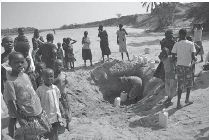
De Kerio rivier is in 2010 opgedroogd. Hierdoor hebben vele duizenden mensen in Lodwar hun voornaamste waterbron verloren! Men moet diep gaan graven om wat water te krijgen.

Het Bisdom Lodwar bestrijkt een oppervlakte van ruim 77.000 vierkante kilometer. Dit is bijna tweemaal zo groot als Nederland (41.000 vierkante kilometer).