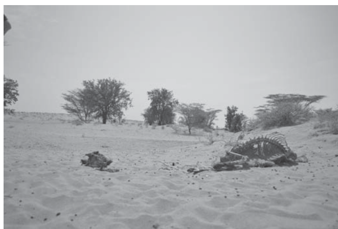
Overal ziet men de resten van de dieren die zo'n belangrijke inkomstenbron zijn geweest voor de mensen in deze regio.