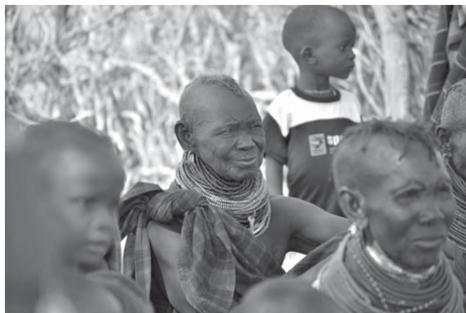
Vrouwen wachten op hun beurt bij één van de vele mobiele klinieken.

Ruim 500.000 mensen zijn in Noord Kenia door de extreme droogte getroffen. Voor de komende vijf maanden heeft het Bisdom Lodwar een noodplan opgesteld voor 5.400 gezinnen, 6.500 kleuters (via de scholen en andere instellingen) en 10.000 kinderen onder de 5 jaar, die niet via deze onderwijsinstellingen bereikt kunnen worden. In dit plan is onder meer opgenomen voedselzekerheid, gezondheidszorg, de distributie van water en de