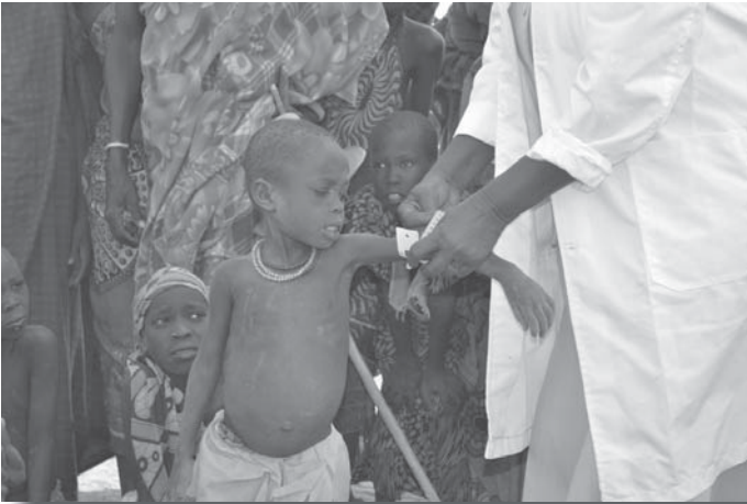
Kinderen en ouderen vormen de meest kwetsbare groep. Hier wordt de omtrek van de arm van een kind gemeten, een maatstaf voor ondervoeding.