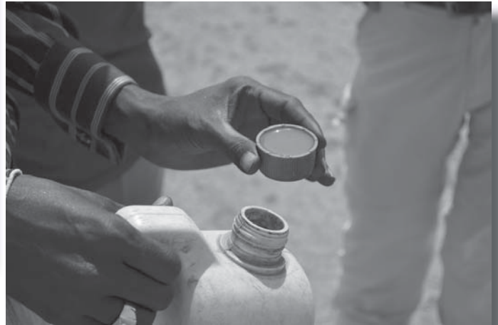
Het water is sterk vervuild en levensgevaarlijk voor de mensen....

water is daarom een essentieel onderdeel voor de bevolking. Hierdoor zijn de mensen dan ook zeer kwetsbaar. Het Bisdom Lodwar heeft de toegankelijkheid tot water en de voedselzekerheid als vast onderdeel opgenomen in het pastoraal beleidsplan.