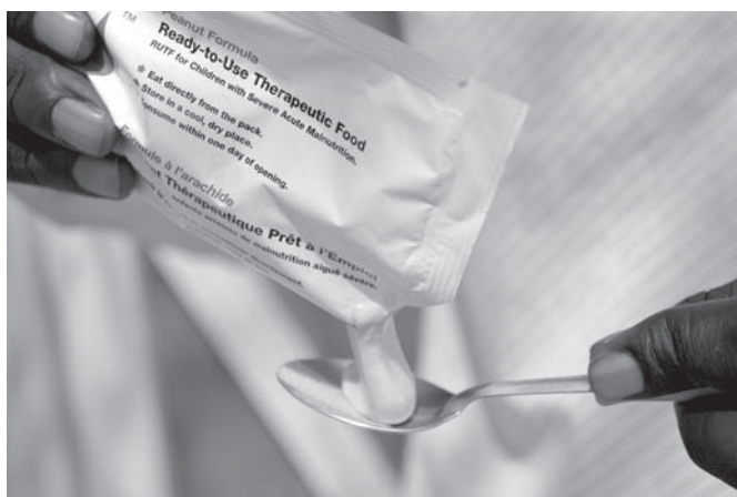
Speciale voeding, zoals dit supplement op basis van pinda's, kan vele levens redden. In het Bisdom Lodwar verzorgen verschillende mobiele klinieken de distributie van deze voeding. Vooral ouderen en kinderen zijn zeer kwetsbaar en raken onder de huidige omstandigheden snel ondervoed.

aanleg van water- en sanitaire voorzieningen, aanschaf en (veterinaire) zorg voor vee, logistiek en rechtshulp en onderwijs.