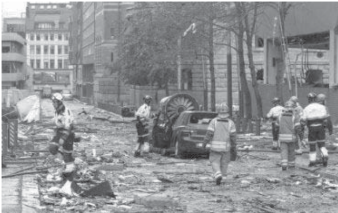
Aanslag in Oslo, Noorwegen

Voor velen is de vakantie voorbij. De trouwe lezers van de nieuwsbrief zijn van mij gewend een vrolijke inleiding te krijgen, maar de vreselijke gebeurtenissen van de afgelopen maanden maken dit onmogelijk. Een man in Noorwegen, die in z'n eentje zoveel leed heeft veroorzaakt. Geen woorden kunnen dit verdriet beschrijven. Zoveel jong leven in enkele ogenblikken op brute wijze beëindigd. Gewoon verschrikkelijk. Natuurlijk komen dan ook de beelden van de moordpartij in een winkelcentrum in Alphen aan de Rijn weer voor de geest, waar eveneens een jonge man aan het leven van mensen een abrupt einde bracht. Laten wij deze slachtoffers en hun familie in ons gebed gedenken.