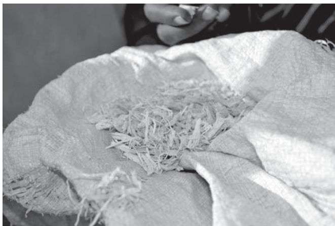
Heel veel mensen proberen nu te overleven door het eten van wilde bessen en stukjes bast van een boom. Ondervoeding en uitdroging vormen nu de grootste bedreiging voor de mensen in de Hoorn van Afrika.

Ruim 500.000 mensen zijn in Noord Kenia door de extreme droogte getroffen. Voor de komende vijf maanden heeft het Bisdom Lodwar een noodplan opgesteld voor 5.400 gezinnen, 6.500 kleuters (via de scholen en andere instellingen) en 10.000 kinderen onder de 5 jaar, die niet via deze onderwijsinstellingen bereikt kunnen worden. In dit plan is onder meer opgenomen voedselzekerheid, gezondheidszorg, de distributie van water en de