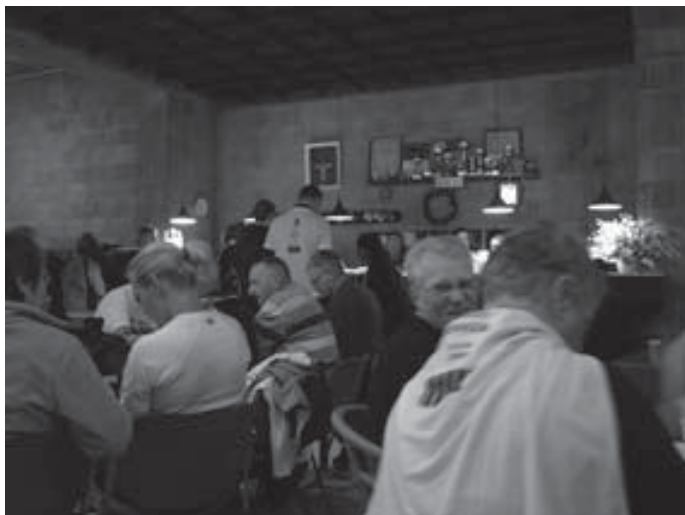
Een gezellig samenzijn met veel informatie

Na de startoproep ging een groep hardlopers op weg, om via de Scheveningse duinen aan te komen bij de Pastoor Van Arsparochie. Anderen, onderwie Bisschop Jos Punt, liepen een wandelroute die hen ondermeer bracht bij