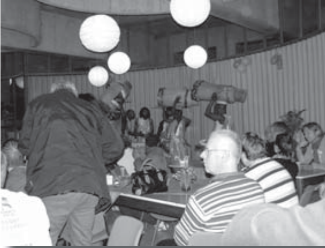
Onder het genot van erwtensoep en roggebrood met spek luisterden de deelnemers naar de toespraken en de muziek

mee Adventsactie samenwerkt, vertelden over de projecten die door deze campagne gesteund worden. Ook het Missieburo was aanwezig om de mensen te vertellen over de catechistenopleidingen in het Bisdom San Marcos, in Guatemala.