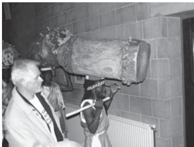
De muziek was oorverdovend!

de ruïne van Maria, Vrouw van Zeven Smarten, een oude bedevaartskerk op de huidige begraafplaats Eik en Duin. Opvallend was het relatief grote aantal jongeren dat deelnam.