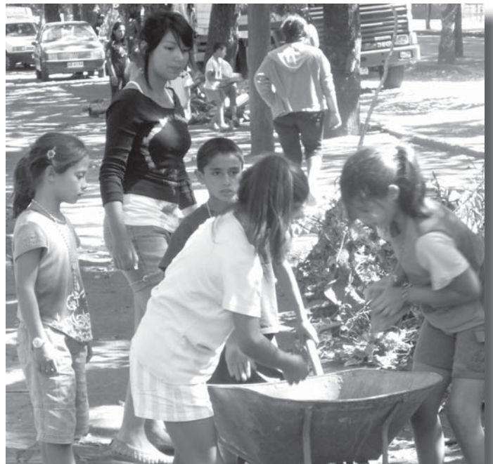
Iedereen helpt bij het opruimen, ook de kleintjes!

Het epicentrum lag circa honderd kilometer ten noordwesten van Concepcion, de derde stad van Chili. In Concepcion en omgeving wonen meer dan een half miljoen mensen. Na de aardbeving waren meerdere naschokken geregistreerd. De zwaarste naschok had een kracht van ongeveer 6,9 op de schaal van Richter, bijna even zwaar als de aardbeving die vorige maand grootschalige