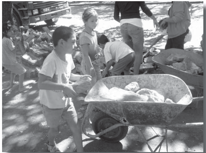
Er is veel puin en de kinderen doen wat ze kunnen.

De totale schade is opgemaakt en er is een bedrag van ruim € 25.000 nodig om alles te kunnen herstellen. Zonnepanelen en zonneboilers zijn