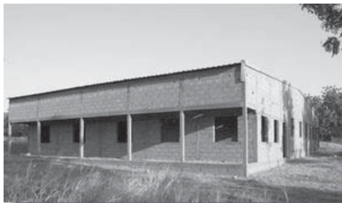
Kraamkliniek nog in aanbouw, Salemboaré.

Mede dankzij de Vastenactie in 3 Limburgse parochies en het Missieburo Roermond heeft men de kraamkliniek in Salemboaré in gebruik kunnen nemen. De zusters van Christus Verlosser en vanzelfsprekend ook de lokale bevolking zijn allen die hieraan hebben bijgedragen zeer dankbaar.