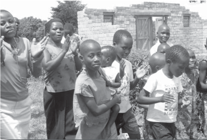
De eerste groep kinderen komt op de nieuwe locatie en viert dit met een dansje.

naar Kampala. Voor de jongste schoolgaande kinderen betekent dit, dat zij waarschijnlijk een schooljaar moeten doubleren. De lessen die in Kampala gegeven worden, zijn in het Engels, terwijl de kinderen van St. Noa's gewend waren om les te krijgen in de locale taal Luganda. De gebouwen, die er nu staan, kunnen met wat kleine aanpassingen geschikt gemaakt worden voor de nieuwe doeleinden. Er zullen echter ook nieuwe gebouwen moeten komen om aan alle nieuwe taken te kunnen voldoen (huisvesting