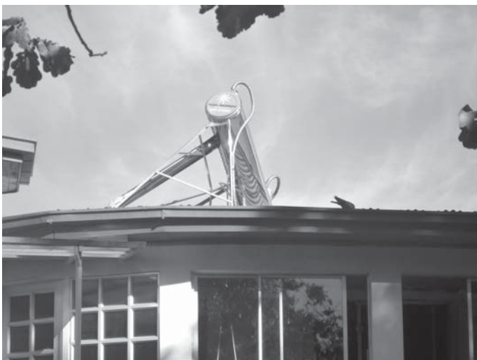
De zonneboiler, althans wat er van over is.

Een andere noodkreet komt uit een ander deel van de wereld, namelijk Oeganda. Pater Piet Hooysschuur wp, die zich reeds meer dan 26 jaar lang over de meest kwetsbare groep van de samenleving bekommert, kinderen, is noodgedwongen St. Noa's Family te verplaatsen naar een andere locatie. In onze nieuwsbrief is