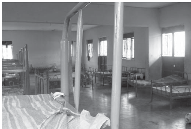
De "tijdelijke" slaapzaal voor de kinderen.

De nieuwe locatie biedt veel meer (keuze-) mogelijkheden voor wat het onderwijs betreft: dus betere scholing. Verder zal St. Noa's totaal onafhankelijk komen te staan van parochie en/of bisdom - natuurlijk wel met de goedkeuring van de lokale bisschop - waardoor de continuïteit van St. Noa's nu beter gewaarborgd wordt. In-