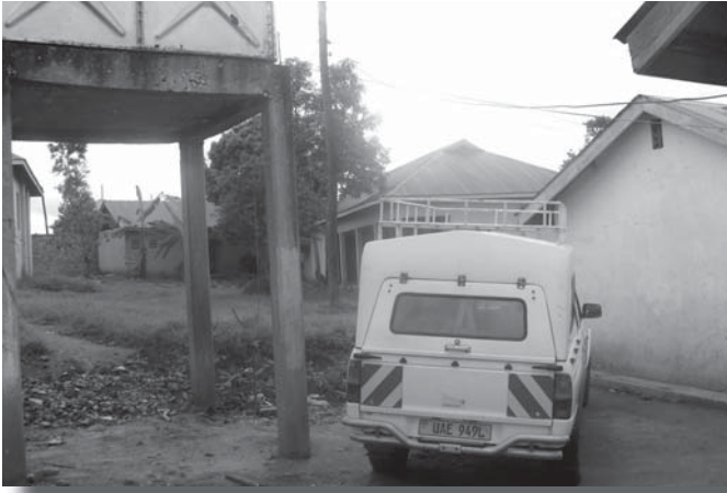
De watertank is klaar voor gebruik. Water is natuurlijk voor het tehuis zeer belangrijk.

naar Kampala. Voor de jongste schoolgaande kinderen betekent dit, dat zij waarschijnlijk een schooljaar moeten doubleren. De lessen die in Kampala gegeven worden, zijn in het Engels, terwijl de kinderen van St. Noa's gewend waren om les te krijgen in de locale taal Luganda. De gebouwen, die er nu staan, kunnen met wat kleine aanpassingen geschikt gemaakt worden voor de nieuwe doeleinden. Er zullen echter ook nieuwe gebouwen moeten komen om aan alle nieuwe taken te kunnen voldoen (huisvesting