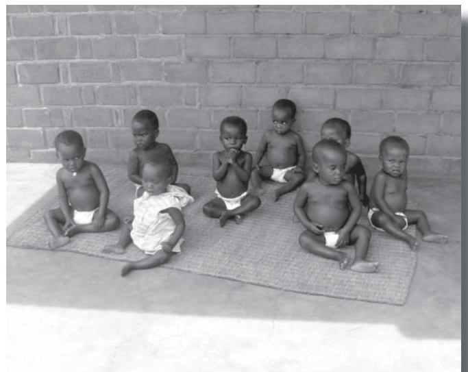
Voor de allerkleinsten zal het zeker wennen zijn, maar zo te zien zullen zij snel aan de nieuwe locatie wennen. Als alles klaar is, zal er ook een mooie grasmat komen, maar voorlopig op een rieten mat.

De vergunningen zijn inmiddels verkregen. Er is echter een nog bedrag nodig van ruim €150.000 om de meest noodzakelijke faciliteiten te realiseren. Er is inmiddels een verzoek voor ondersteuning ingediend bij de Nationale Commissie voor Duurzame Ontwikkelingssamenwerking (NCDO). Dit jaar zal deze organisatie voor het laatst een dergelijke subsidie kunnen geven. Vanzelfsprekend hopen wij op een positief bericht! Alle opbrengsten kunnen dan verdubbeld worden. U wilt toch ook een steentje bijdragen aan dit project? Alvast heel hartelijk bedankt!