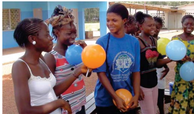
Schoolmeisjes in Taiama, Sierra Leone