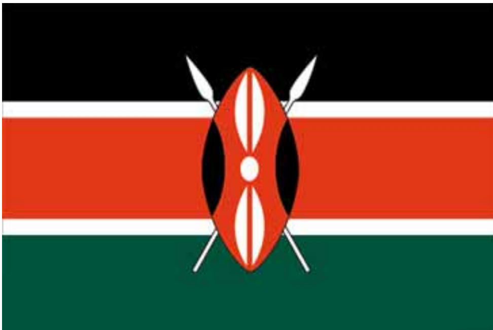
Vlag van Kenia

Administratief is Kenia verdeeld in zeven provincies en een provinciaal district: Nairobi. De provincies zijn onderverdeeld in 53 districten.