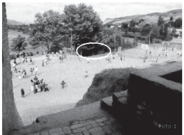
Hier komt de nieuwe praktijkruimte.