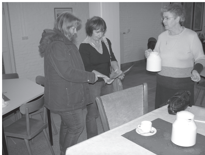
Vergadering MOV-Heerlen/Landgraaf ter voorbereiding van de Vastenactie

Zo schrijft mevrouw Karimi, "Het WRR-rapport over ontwikkelingshulp is een doorwrochte analyse van de complexiteit van ontwikkeling in een geglobaliseerde wereld. Het rapport geeft veel stof tot nadenken en levert een stevige bijdrage aan de discussie over internationale samenwerking. De WRR spaart de huidige hulpsector niet, maar hekelt tegelijkertijd het hulp cynisme dat in Nederland heerst. Ontwikkelingshulp blijft nodig, constateert de WRR, maar het moet beter. Dat vind ik ook." Verder in het artikel maakt mevrouw Karimi een opmerking die mijns inziens tekortkomingen van de huidige ontwikkelingssamenwerking wel goed typeert: "Ook deel ik de constatering van de WRR dat ontwikkelingshulp in een veel bredere context gezien moet worden. Ontwikkelingshulp alleen kan het armoede vraagstuk niet oplossen.