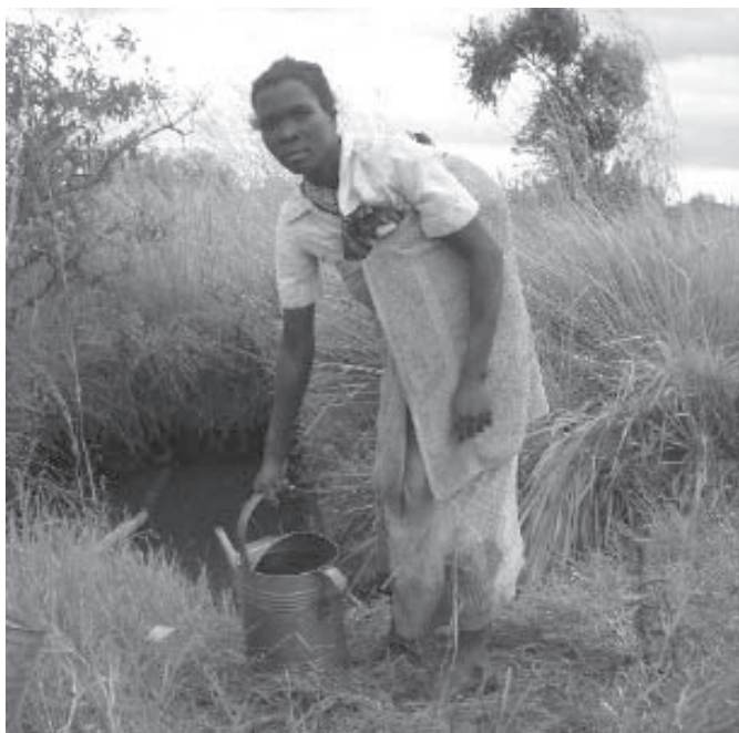
Toegang tot water, dat maakt een verschil

oorzaak genoemd voor de droogte en overstromingen waar gemeenschappen steeds meer mee te kampen hebben. Tabak is het belangrijkste exportproduct. In Lilongwe en Mzuzu zijn grote veilingen waar de balen in enorme hoeveelheden worden opgekocht van kleinschalige producenten in de dorpen. Een kilo doet momenteel al gauw $2,50 dus voor veel mensen is het een aantrekkelijke bron