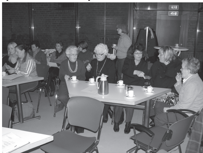
Startavond Dekenale Werkgroep Thorn/Heythuysen luisterend naar een verhaal over Malawi.

Voor velen betekent de Veertigdagentijd niet alleen een tijd van bezinning en voorbereiding op het hoogfeest van Pasen, maar ook een tijd van actie! Elk jaar zetten vele tientallen