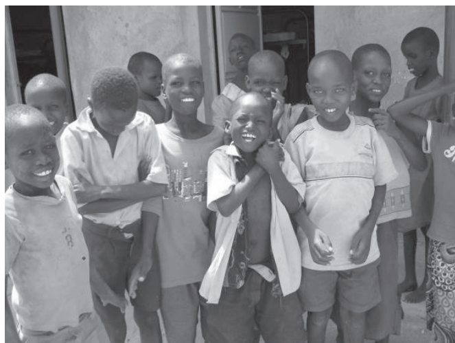
Ziende en blinde kinderen samen op één school, iets wat je bijna nooit tegenkomt in Kenia!

De kinderen zijn u zeer dankbaar, want dankzij uw steun kunnen zij een mooie toekomst tegemoet zien!