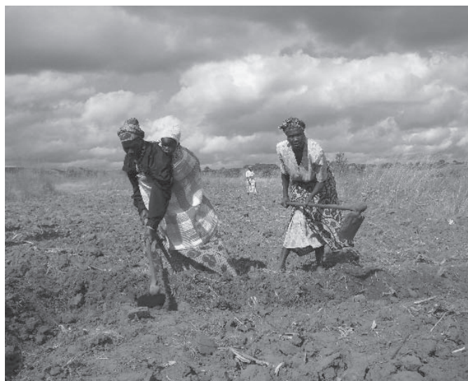
Cadecom investeert in mensen

In Noord Malawi leven duizenden boerengezinnen van de landbouw. Door de nu al sterk merkbare klimaatsverandering zijn de