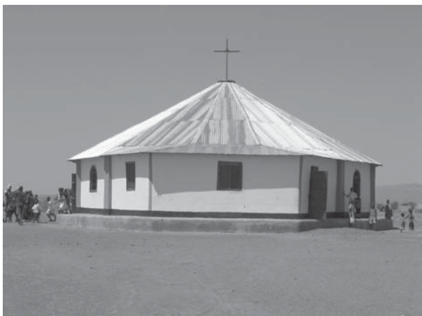
Eén van de kerkjes die gebouwd zijn met steun van de Vastenactie Campagne.