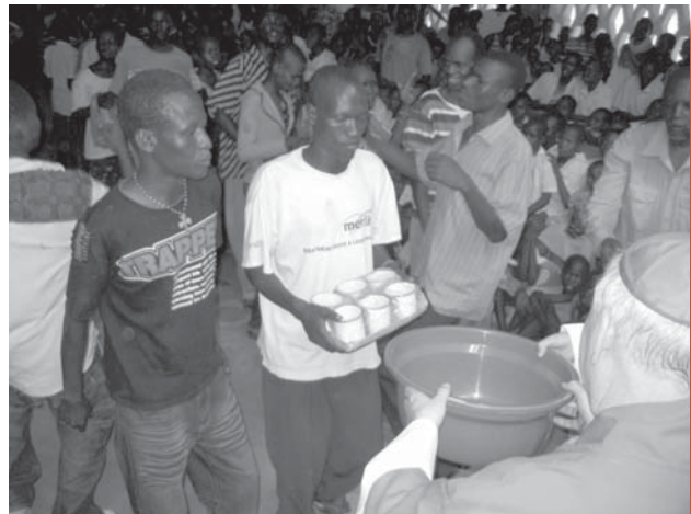
De collecte in "natura"!