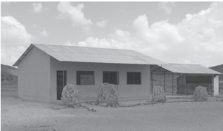
Een kleuterschool van het "Nutritional Rehabilitation" Programma.

Het diocees Lodwar dat in 1978 werd opgericht, telt 16 parochies en ruim 300 buitenstaties. Van