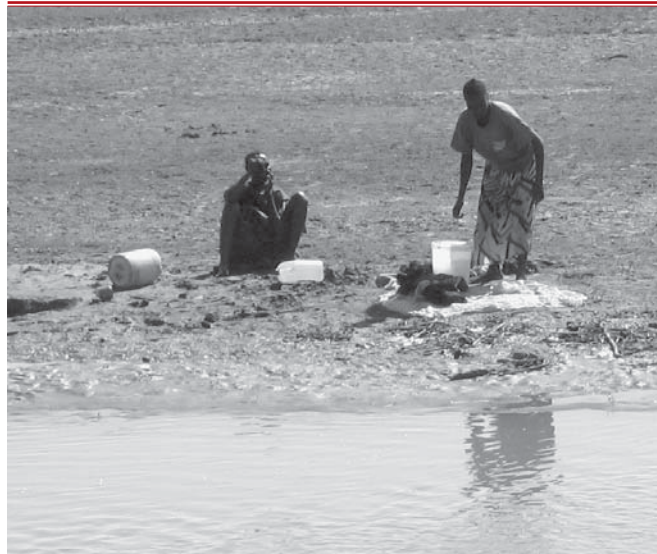
Water, van levensbelang!