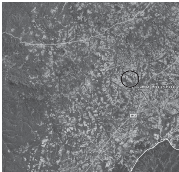
Lumezi (omcirkeld), Zambia.