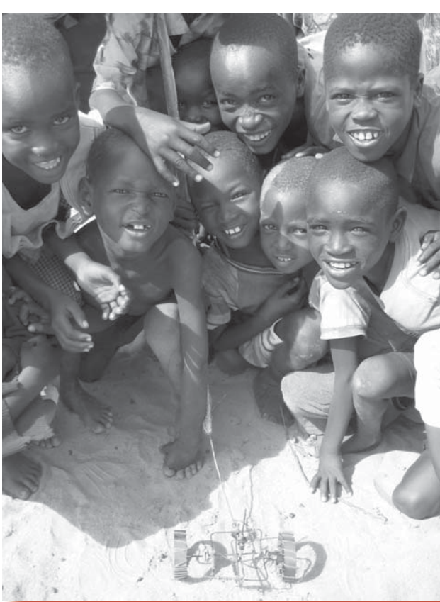
Kinderen vermaken zich met zelf-gemaakt speelgoed!

en slechts een kwart kan enigszins rekenen op een bepaalde vorm van gezondheidszorg.”