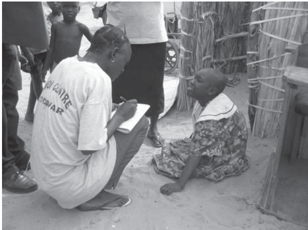
Het Ewoi programma.

Deze projecten zijn gesteund door de Vastenactie 2008