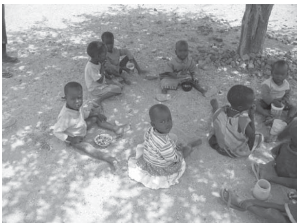
Kleuters genieten van een heerlijke en gezonde lunch.