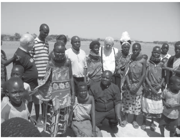
Een warm ontvangst door de parochianen.