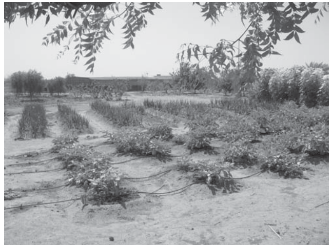
Dankzij het irrigatieproject hogere opbrengsten.