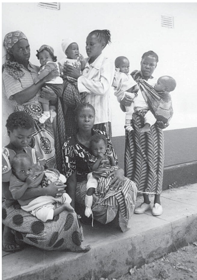
Moeders wachten buiten met hun kroost.

Lumezi ligt in het midden van Zambia in een afgelegen gebied. De (Afrikaanse-) Zusters van de O.L. vrouw van Kilimanjaro werken in de gezondheidszorg. Zo worden meerdere ziekenhuizen in Zambia, Tanzania en Kenia door de zusters gerund. De grootste gezondheidsproblemen zijn Aids, tuberculose en ziekten die te herleiden zijn tot slechte voeding.