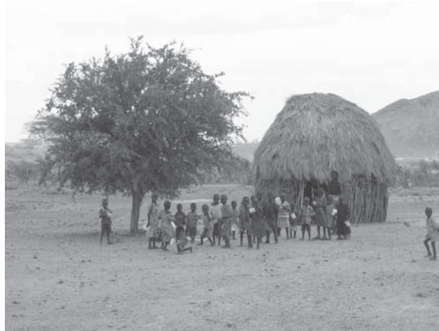
Het onderwijs en voedsel programma.