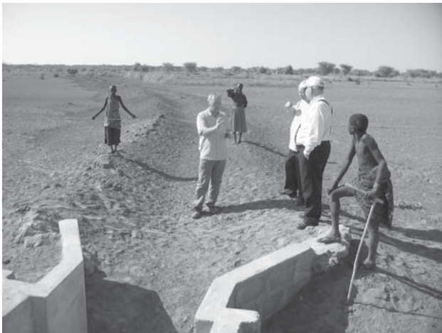
Eén van de waterprojecten van het Pastoraal Plan.