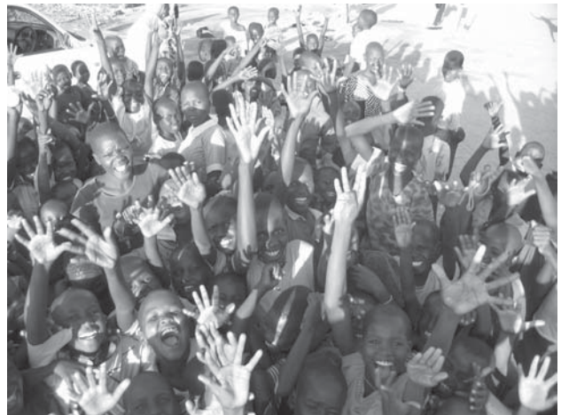
Straatkinderen opgevangen door de Fraters van Utrecht.

De mensen van het Bisdom Lodwar danken u voor uw solidariteit en financiële ondersteuning!