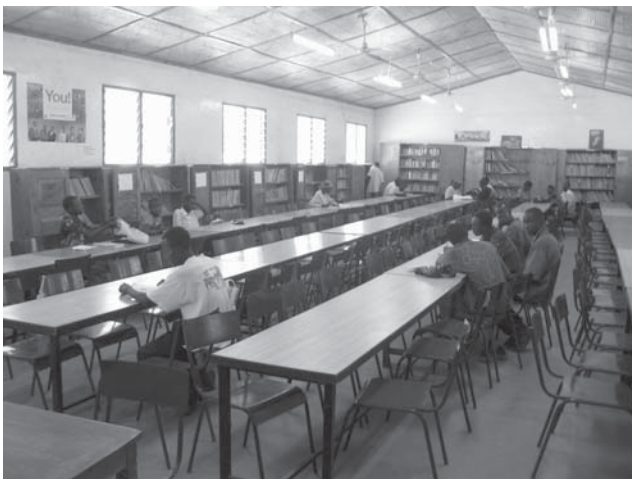
Het sponsorprogramma voor middelbare scholieren.