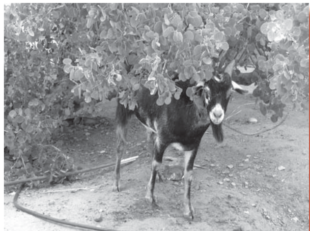
Eén van de twee geiten die de bisschop kado heeft gekregen.